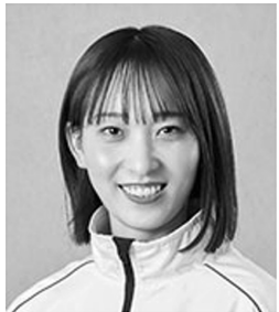
5088 高憧 四季